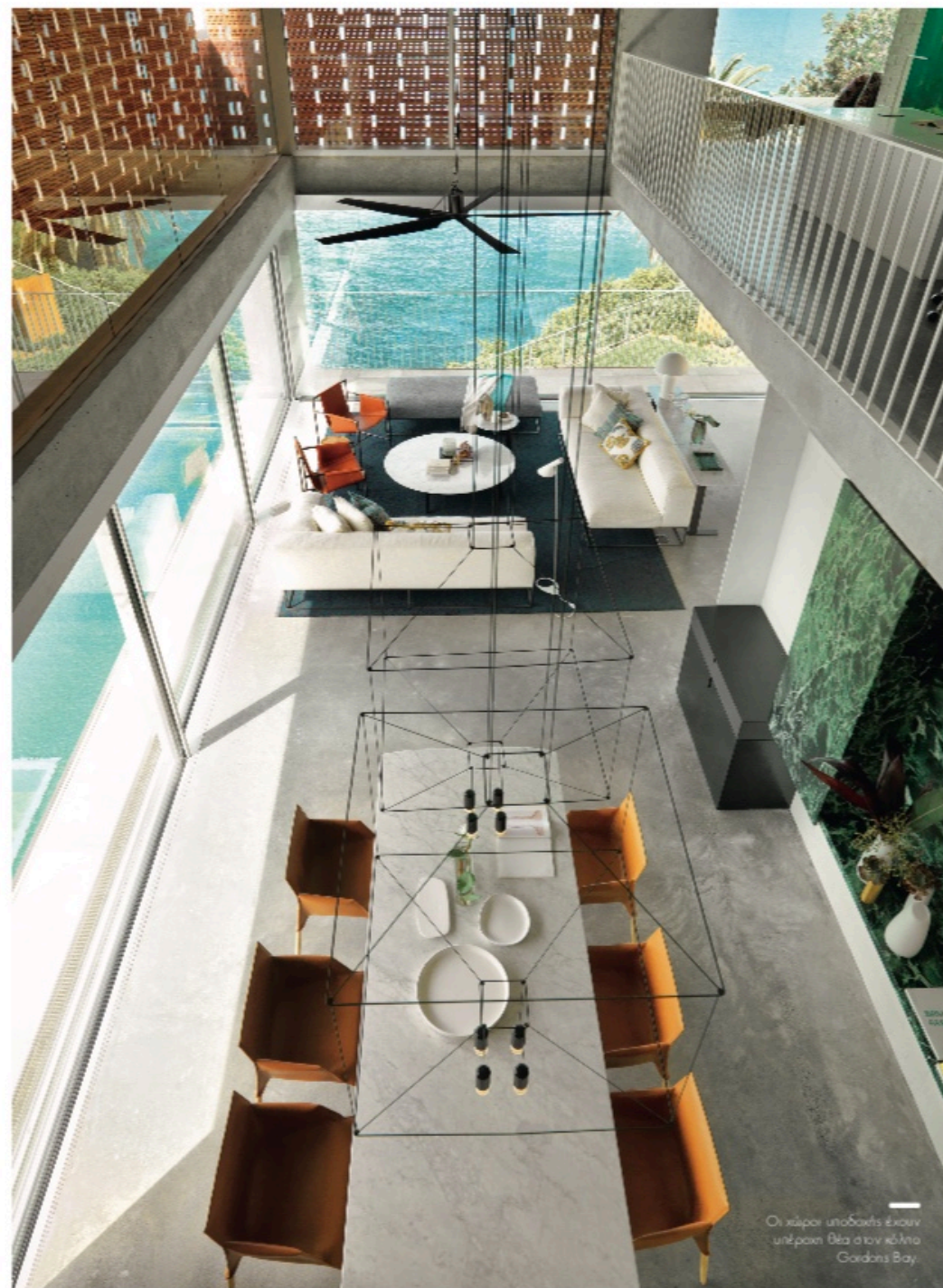
Οι κάποιιοι υποδοχείς έχουν υπέροχη θέα στον κόλπο Gardons Bay.

● Η αρχιτεκτονική του Renato D'Ettoe αντλεί έμπνευση από παλιούς δασκάλους και πολιτισμούς, προσπαθώντας να εκπροσωπήσει το παρόν με την επιθυμία να μένουν τα κτήριά του αντιπροσωπευτικά για το μέλλον. «Στόχος μας είναι να δημιουργήσουμε μια αρχιτεκτονική που να προκαλεί την αίσθηση του τόπου και της ομορφιάς, να ικανοποιεί την ανθρώπινη ανάγκη για δημιουργικές εκφράσεις. Να ηρεμεί αλλά και να διεγείρει τις αισθήσεις με το φως και τη σκιά, το χρώμα και την υλικότητα, μειώνοντας ταυτόχρονα την πολυπλοκότητα και επιτυγχάνοντας την απλότητα, τονίζοντας τα φθιμερά στοιχεία που μπορεί να δημιουργήσει η καλή αρχιτεκτονική», αναφέρει ο αρχιτέκτονας. Το αποτέλεσμα είναι ένα σπίτι που ανταποκρίνεται στον καθημερινό ρυθμό της φύσης. «Με το πέρασμα του χρόνου τα φυσικά υλικά θα παλιώνουν με χάρη, επιτυγχάνοντας την πατina που δημιουργεί η φύση και τα στοιχεία της», εξηγεί. ▶